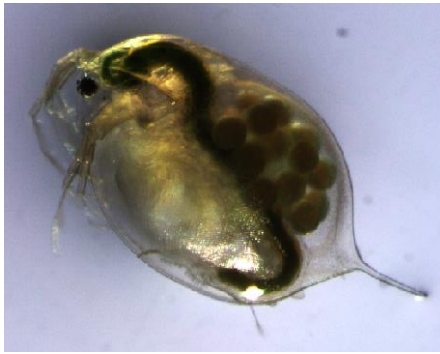
Daphnia magna of de watervlo.