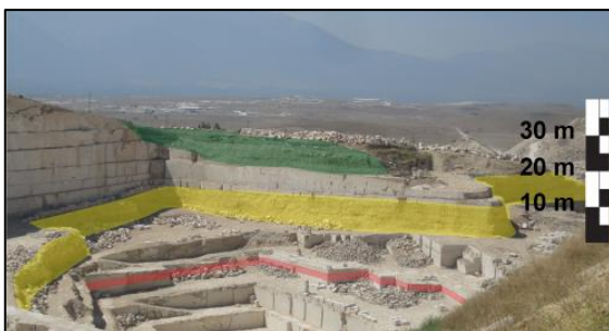
Figuur 3: Travertijn groeve in Denizli (Turkije) met drie verschillende detritische intervallen (rood, geel en groen).