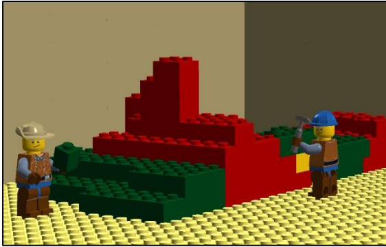
Figuur 4: Een reservoirmodel valt simplistisch voor te stellen als een LEGO®-constructie. De positie en het formaat van de LEGO®-blokjes worden bepaald door de vormingscondities, terwijl de hoeveelheid olie gecontroleerd wordt door de reservoirkenmerken.