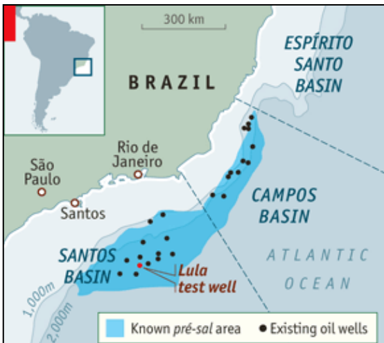
Figuur 1: Ligging van het Lula-veld en de verspreiding van de Pre-Salt afzettingen (Bron: The Economist, 2008).