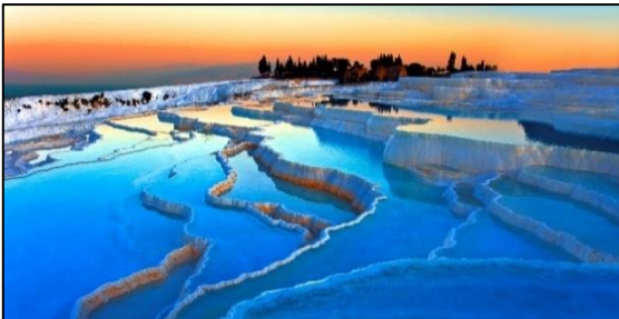
Figuur 2: Travertijn in Pamukkale (Turkije) (Bron: TuristaTravel, 2016).