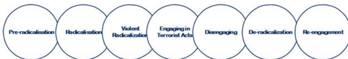
Figuur 1.1: De terroristische levenscyclus (Horgan, 2009, p. 151)