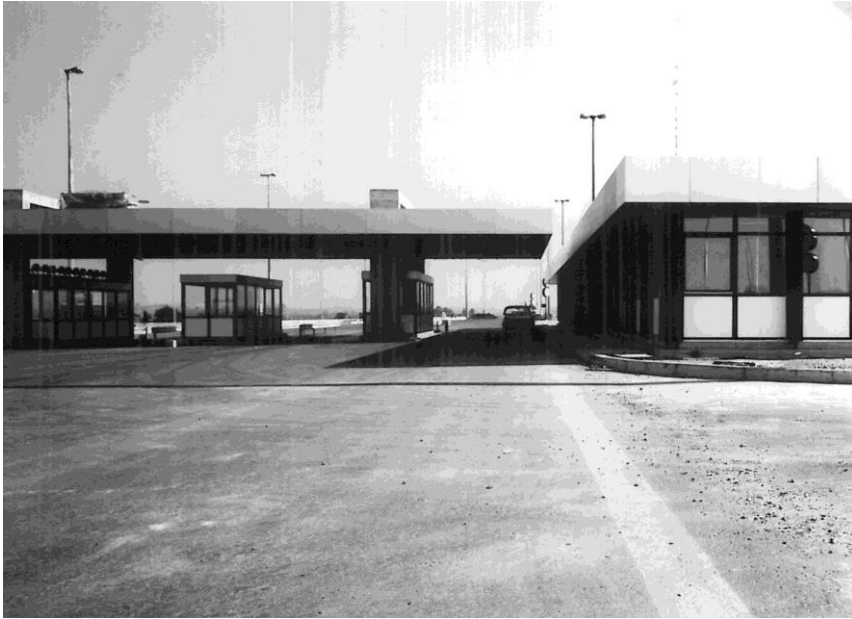
Werffoto grenspost Rekkem