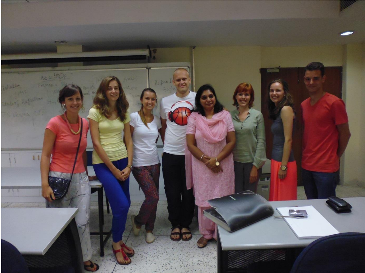
Op de National Law University, New Delhi. Daar kregen we les over onze onderzoeksonderwerpen. Ik sta links.