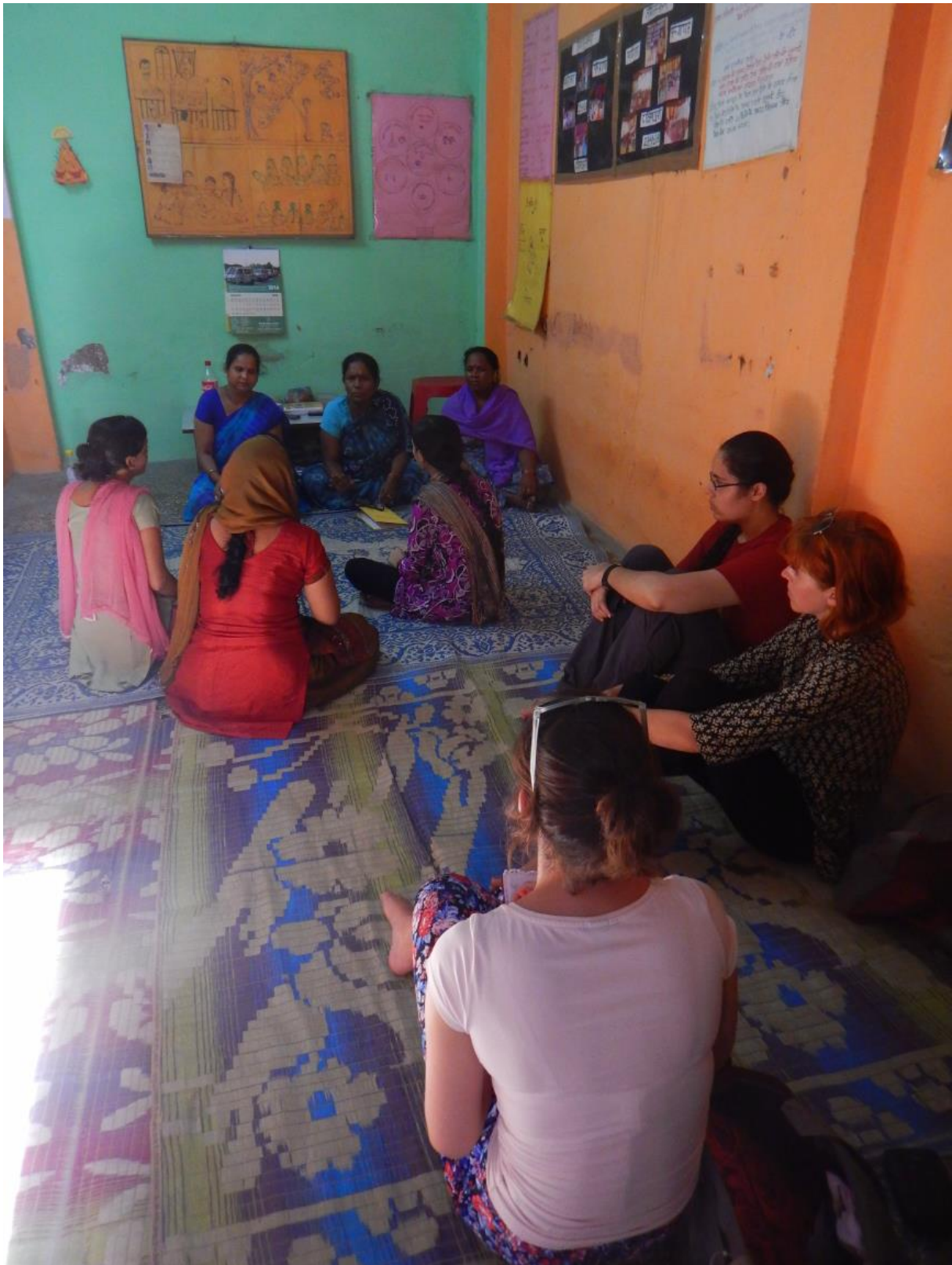
In de Mahila Panchayat (of vrouwenvolksraad), gerelateerd aan Action India, New Delhi. Ik observeer de werking en heb achteraf een gesprek met de raadgeefster. Het is een organisatie waar vrouwen en hun familieleden naartoe komen om een oplossing te vinden voor een probleemsituatie.