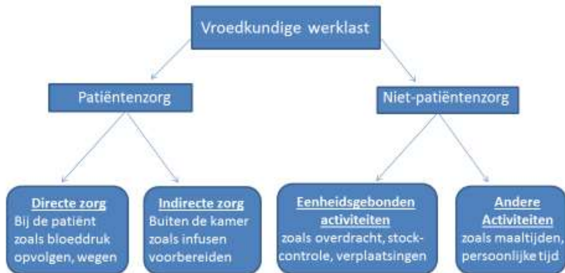
Figuur 1: Vroedkundige werklust

Vroedkundige werklust in tijden van een verkort materniteitsverblijf